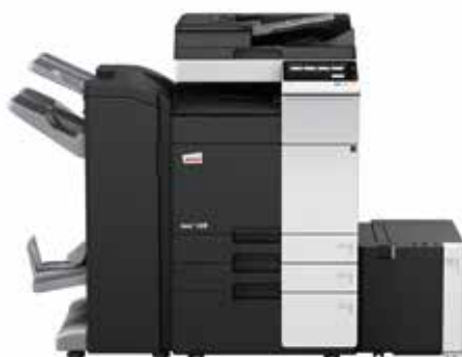
ineo+ 258 com alimentador de documentos dual scan (DF-704), finalizador de brochuras (FS-534SD), cassette de grande capacidade (LU-302) e cassette de papel (PC-410)