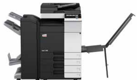
ineo+ 258 com alimentador de documentos dual scan (DF-704), finalizador de brochuras (FS-534SD), tabuleiro banner (BT-C1e) e cassette de papel (PC-210)