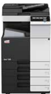
ineo+ 258 com alimentador de documentos dual scan (DF-704), tabuleiro de saída (OT-506) e cassette de papel (PC-210)

Invista numa ineo+ 258 e já não fica dependente de lojas externas para os trabalhos especializados como por exemplo convites impressos em papel grosso de alta qualidade. Isso irá poupar-lhe muito tempo e dinheiro. A ineo+ 258 pode lidar com envelopes, papel reciclado, papel pré-impresso, acetatos, muitos outros suportes e até mesmo cartão com uma espessura de até 300 g/m 2 . Estes sistemas podem imprimir numa ampla gama de formatos de papel desde A6 a A3+ (SRA3) ou formatos definidos pelo utilizador e banners até 1.2 metros de comprimento. E mais, as inúmeras opções de finalização permitem a criação de brochuras de até 80 páginas, cartas dobradas de várias maneiras, manuais agrafados ou faturas furadas. Quase qualquer tipo de trabalho pode ser produzido internamente numa ineo+ 258.