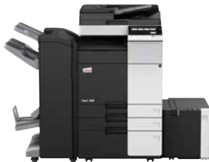
ineo+ 308 com alimentador de documentos dual scan (DF-704), finalizador de brochuras (FS-534SD), cassette de grande capacidade (LU-302) e cassette de papel (PC-410)