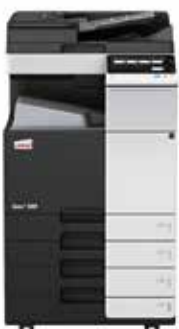
ineo+ 308 com alimentador de documentos dual scan (DF-704), tabuleiro de saída (OT-506) e cassette de papel (PC-210)

Invista numa ineo+ 308 e já não fica dependente de lojas externas para os trabalhos especializados como por exemplo convites impressos em papel grosso de alta qualidade. Isso irá poupar-lhe muito tempo e dinheiro. A ineo+ 308 pode lidar com envelopes, papel reciclado, papel pré-impresso, acetatos, muitos outros suportes e até mesmo cartão com uma espessura de até 300 g/m 2 . Estes sistemas podem imprimir numa ampla gama de formatos de papel desde A6 a A3+ (SRA3) ou formatos definidos pelo utilizador e banners até 1.2 metros de comprimento. E mais, as inúmeras opções de finalização permitem a criação de brochuras de até 80 páginas, cartas dobradas de várias maneiras, manuais agrafados ou fatu-ras furadas. Quase qualquer tipo de trabalho pode ser produzido internamente numa ineo+ 308.