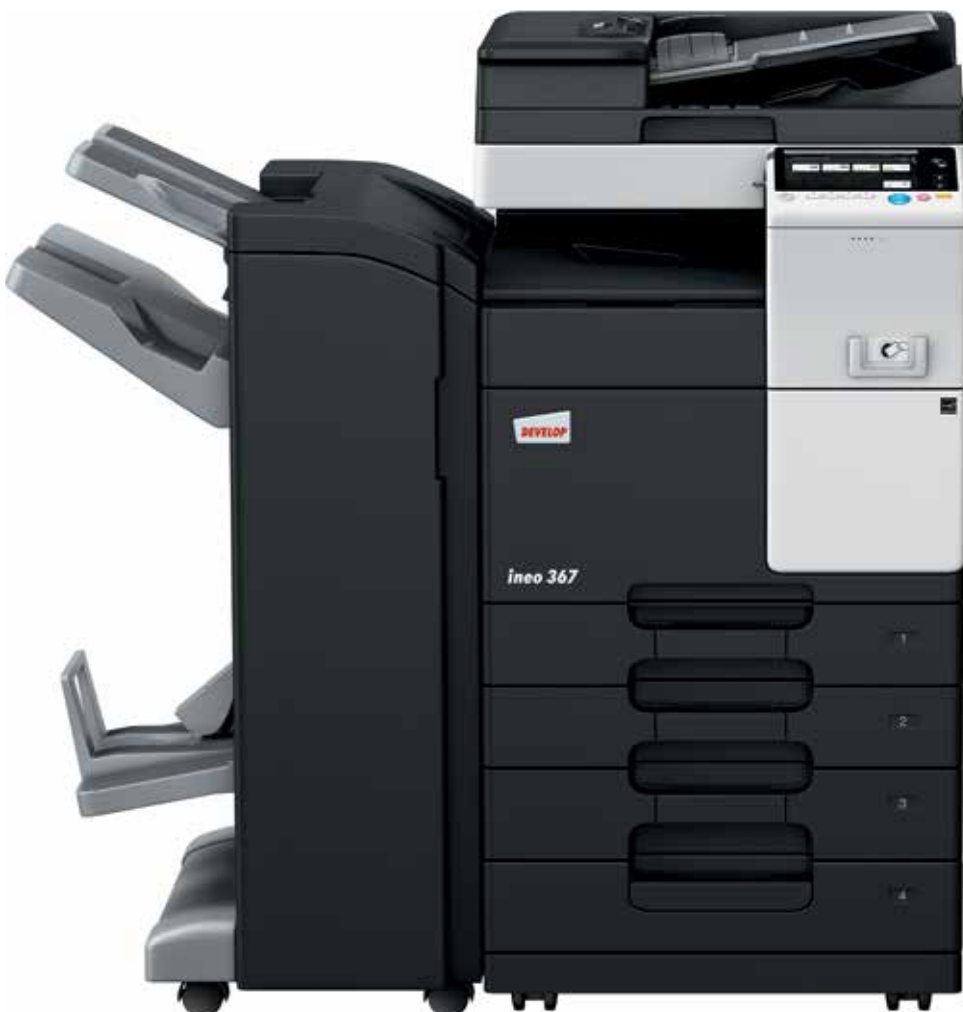
ineo 367 com alimentador de documentos (DF-628), finalizador interno (FS-533), cassette de papel (PC-413) e kit montagem para dispositivo de autenticação por cartão (MK-735)

Centros de emprego, escolas e universidades, empresas de engenharia, escritórios de arquitetos, companhias de seguros, bancos, bibliotecas: muitas pequenas e médias empresas ou organizações realmente não precisam de capacidades de impressão a cores. O que os seus utilizadores realmente necessitam é um multifuncional monocromático que é fácil de usar e oferece uma usabilidade móvel simples para um número cada vez maior de colaboradores móveis.