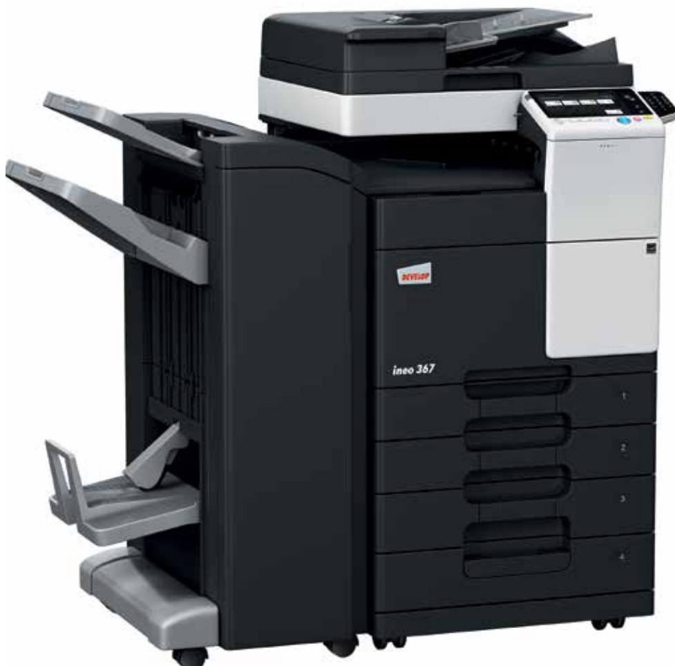
ineo 367 com alimentador de documentos (DF-628), finalizador de brochuras (FS-534SD), cassette de papel (PC-213) e teclado numérico (KP-101)

Os equipamentos monocromáticos representam uma variedade de funções que reduzem o consumo energético. Além de lhe poupar dinheiro, estas caraterísticas verdes também fazem bem ao ambiente – e à sua pegada de carbono.