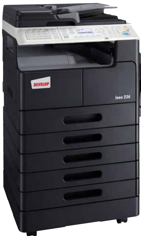
ineo 226 com alimentador de documentos duplex (DF-625) , funcionalidade fax, unidade duplex (AD-509), cassetes de papel adicionais (PF-507) e mesa (DK-708)

Os utilizadores são muitas vezes sobrecarregados ao utilizar os equipamentos multifuncionais modernos. Aqui, também, a ineo 226 é uma exceção agradável porque foi especialmente concebido para facilidade de operação. Um painel simples de usar guia os utilizadores por todas as funções do sistema para que possam ver num ápice que precisam de fazer.