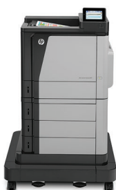
Impressora HP Color LaserJet Enterprise M651xh