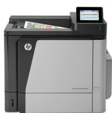
Impressora HP Color LaserJet Enterprise M651dn

Desempenho em que pode confiar: documentos frente e verso a cores com qualidade profissional e de grande volume com extraordinária fiabilidade. A eficiente impressão de um toque e opções de impressão móvel, para além da gestão simples ajudam-no a ser produtivo onde o trabalho o levar.