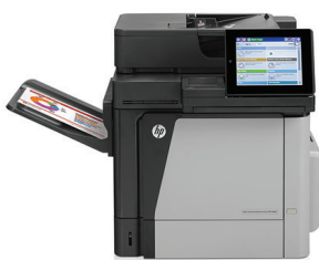
Impressora multifunções HP Color LaserJet Enterprise M680dn

Lide com trabalhos de grande volume com esta MFP a cores de alto desempenho. Impressão, cópia, digitalização e fax 1 . Funções de digitalização melhoradas e o ecrã tátil a cores de 20 cm (8 pol.) asseguram o bom funcionamento dos fluxos de trabalho. A impressão móvel ajuda-lhe a manter a produtividade em viagem 2 .