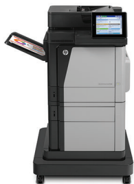
Impressora multifunções HP Color LaserJet Enterprise M680f