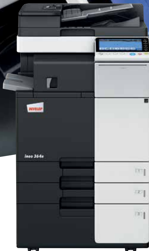
ineo 364e com alimentador de documentos (DF-624) e cassette de grande capacidade (PC-410)