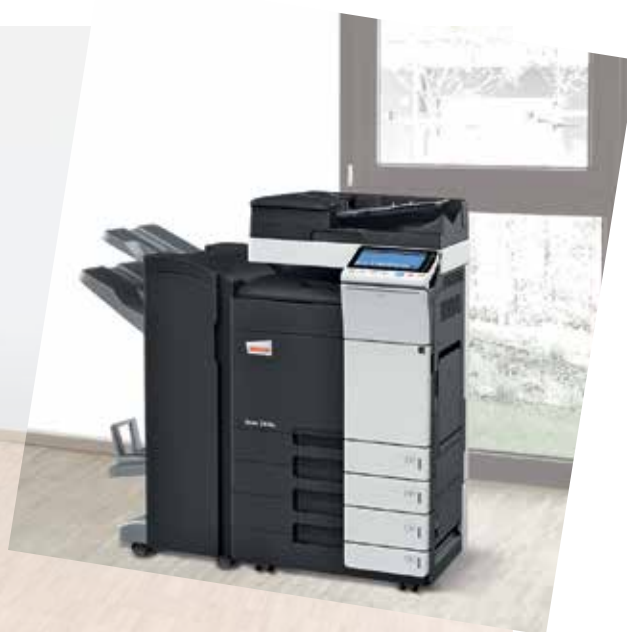
ineo 364e com alimentador de documentos dual scan (DF-701), finalizador de brochuras (FS-534SD) e cassete de papel (PC-210)