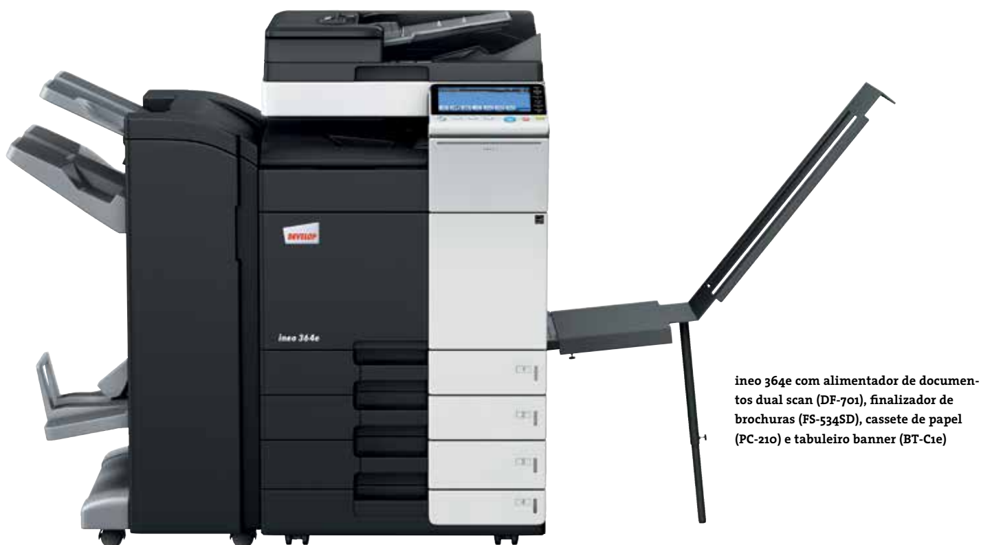
ineo 364e com alimentador de documentos dual scan (DF-701), finalizador de brochuras (FS-534SD), cassete de papel (PC-210) e tabuleiro banner (BT-C1e)

Cada um destes equipamentos multifuncionais de escritório – a ineo 224e, a ineo 284e, a ineo 364e, a ineo 454e e a ineo 554e – não é apenas fácil de usar, mas também oferece uma grande variedade de características para facilitar as tarefas diárias. Ao poupar tempo aos utilizadores na impressão, cópia ou digitalização, eles podem voltar mais rapidamente ao seu trabalho normal. E isso irá ajudar a acelerar a produtividade.