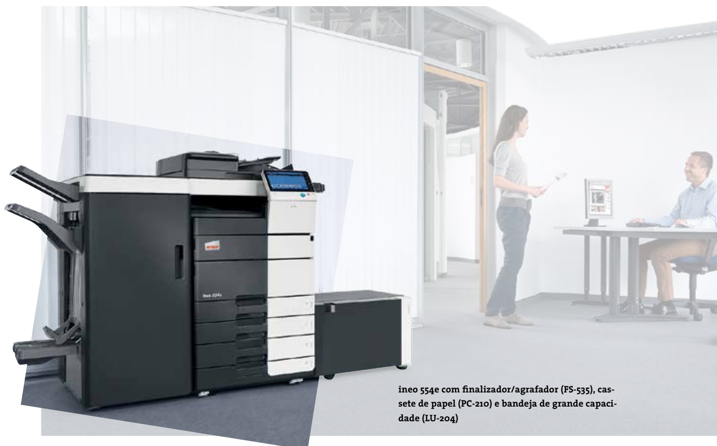
ineo 554e com finalizador/agrafador (FS-535), cassette de papel (PC-210) e bandeja de grande capacidade (LU-204)

Estes sistemas a preto & branco vêm com várias características ecológicas que reduzem o consumo energético com mais de 40% comparado com os modelos anteriores. Enquanto este tipo de economia poupa dinheiro, outras características verdes são ecológicamente benéficas. E isso significa que a linha ineo “e” da DEVELOP não é apenas bom para o ambiente, mas também acelera as credenciais verdes do proprietário.