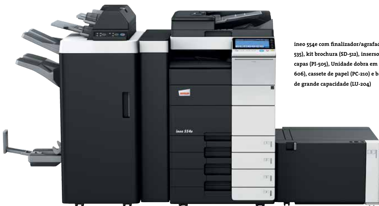
ineo 554e com finalizador/agrafador (FS-535), kit brochura (SD-512), insersor de capas (PI-505), Unidade dobra em Z (ZU-606), cassete de papel (PC-210) e bandeja de grande capacidade (LU-204)

Cada um destes equipamentos multifuncionais de escritório – a ineo 224e, a ineo 284e, a ineo 364e, a ineo 454e e a ineo 554e – não é apenas fácil de usar, mas também oferece uma grande variedade de características para facilitar as tarefas diárias. Ao poupar tempo aos utilizadores na impressão, cópia ou digitalização, eles podem voltar mais rapidamente ao seu trabalho normal. E isso irá ajudar a acelerar a produtividade.