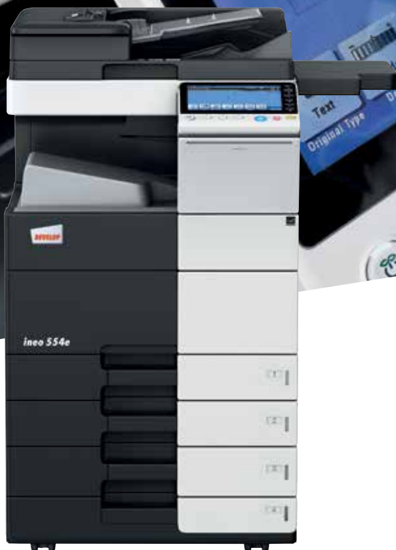
inoe 554e com cassete de papel (PC-210), mesa de suporte (WT-506) e tabuleiro de saída (OT-506)