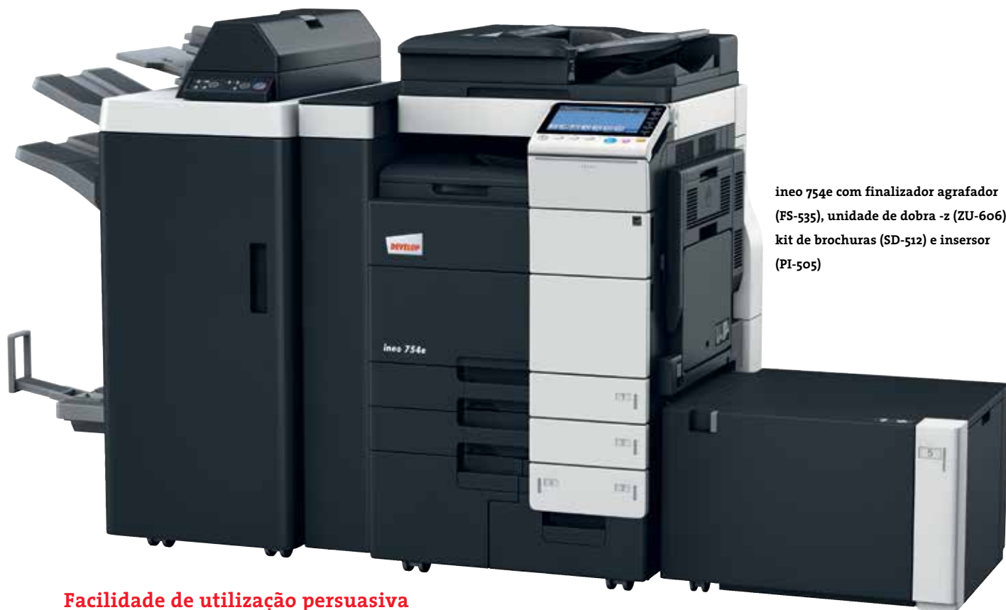
ineo 754e com finalizador agrafador (FS-535), unidade de dobra -z (ZU-606), kit de brochuras (SD-512) e insersor (PI-505)