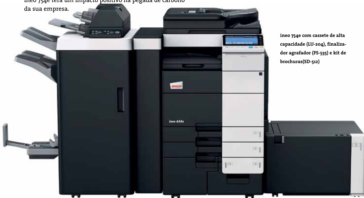
ineo 754e com cassete de alta capacidade (LU-204), finalizador agrafador (FS-535) e kit de brochuras(SD-512)

Ataques de hackers, vírus, programas Trojan: nos dias que correm, nenhum negócio pode dar-se ao luxo de ignorar o desafio que representa a segurança informática. É por esse motivo que a ineo 754e está certificada pela ISO 15408 EAL 3, que é a norma de segurança da indústria para os sistemas multifuncionais. Além disso, também está equipada com inúmeras características de segurança de dados, como a encriptação IPsec, que garante a comunicação segura para todos os documentos que passam através da rede da sua empresa. Não existe o perigo de documentos ou dados confidenciais irem parar às mãos erradas, porque o acesso ao sistema pode ser restringido a utilizadores autorizados através do kit de encriptação do disco rígido standard e da tecnologia de autenticação. Desta forma, garantimos que os seus dados sensíveis se mantêm seguros – agora e no futuro.