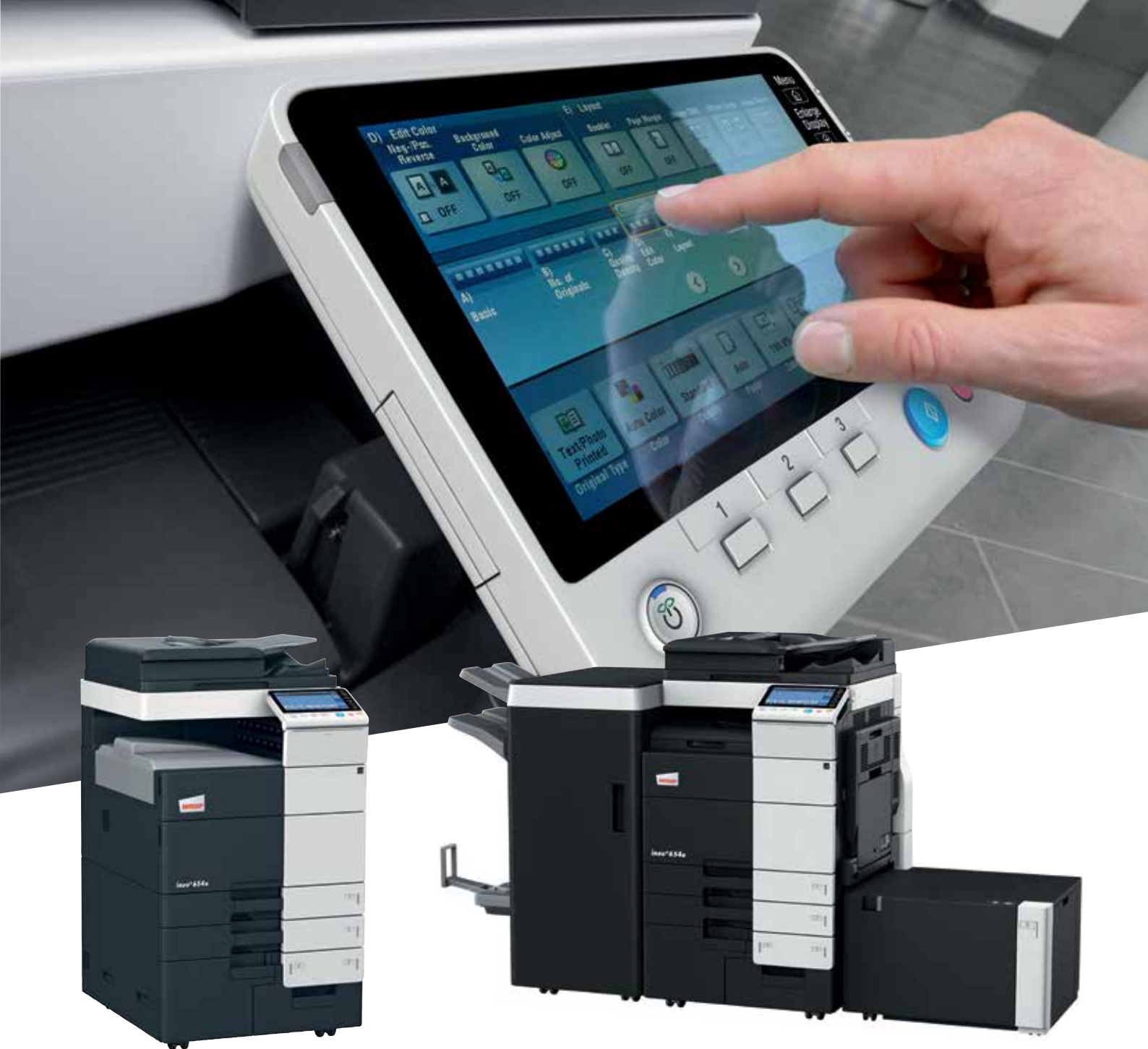
ineo+ 654e com tabuleiro de saída (OT-503)