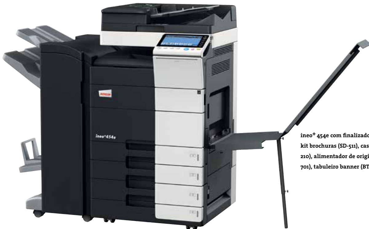
ineo+ 454e com finalizador agrafador (FS-534), kit brochuras (SD-511), cassetes de papel (PC-210), alimentador de originais dual scan (DF-701), tabuleiro banner (BT-C1e)