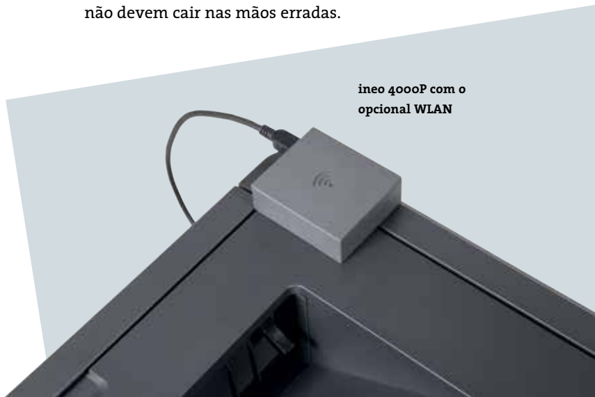
ineo 4000P com o opcional WLAN

Caso não tenha muito espaço no seu escritório ou precisa mesmo de uma impressora de mesa, o desenho leve e pegada reduzida da ineo 4000P são uma grande vantagem. O facto que esta impressora eficiente de escritório poderá ser colocada com facilidade em cima de uma mesa e não precisa de um próprio espaço, é extremamente conveniente para uma equipa por exemplo num departamento de RH ou financeiro, onde documentos confidenciais não devem cair nas mãos erradas.