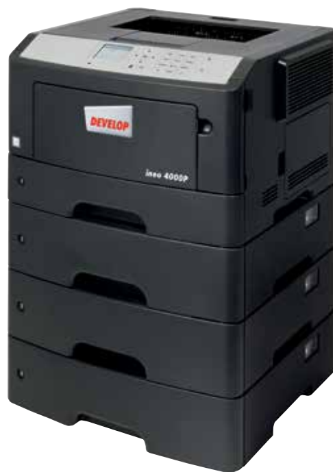
ineo 4000P com 3 cassetes adicionais de 550 folhas (PF-P11)

Caso o sistema operativo da sua impressora atual seja difícil de seguir e o equipamento seja difícil de usar, está na hora de considerar mudar para a ineo 4000P. O seu painel a cores de 2.4 polegadas garante uma operacionalidade intuitiva e menus destacados mostram aos utilizadores o estado do sistema, opções de operação e configurações. E mais, um conceito de navegação tipo pasta significa que a ineo 4000P é mais fácil de utilizar que qualquer outro sistema mais antigo. Isto poupa tempo e esforço à sua equipa na impressão de trabalhos diários. E ninguém terá de consultar o manual de operador antes de usar esta nova impressora.