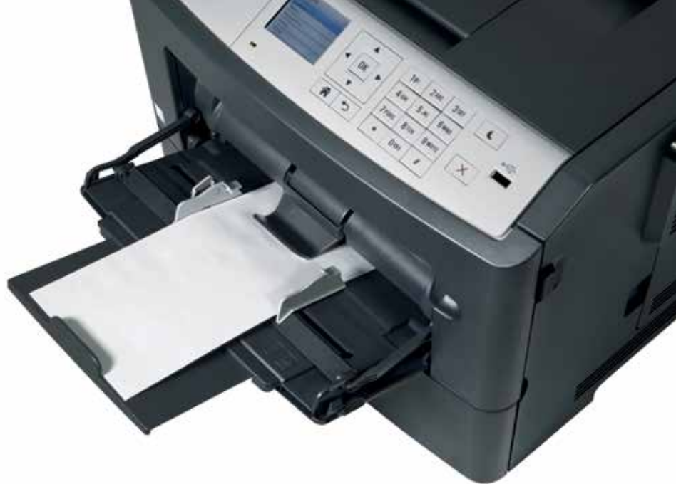
Tabuleiro de multi-uso para a impressão em suportes especiais como envelopes

Trabalhos de impressão de alto volume são comuns no seu negócio? Com uma capacidade máxima de 2,000 folhas pode ter a certeza de que a ineo 4000P não ficará sem papel. E caso frequentemente imprima em vários tipos de papel, por exemplo com ou sem papel timbrado, poderá equipar a sua ineo 4000P com até três cassetes de papel (com 250 ou 550 folhas). Caso as cassetes tenham papel de tipo, formato e gramagem diferente (A6-A4 e 60-163 g/m 2 ), poderá garantir que a sua equipa não perde tempo trocando de um tipo de papel para o outro, ou voltar para a impressora que ficou sem papel.